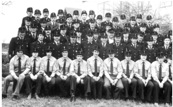
Die Wehr im Jubiläumsjahr 1979