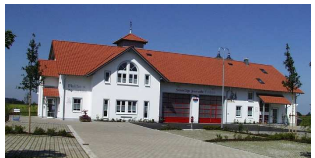
Das neue Feuerwehr und Vereinshaus

Am 17. Juni wird das neue Feuerwehr und Vereinshaus mit einem Festgottesdienst und einem anschließenden Tag der offenen Tür eingeweiht. In das Haus wurden von den beteiligten Vereinen, freiwillige Feuerwehr Lachen, Musikkapelle Lachen, Sch-